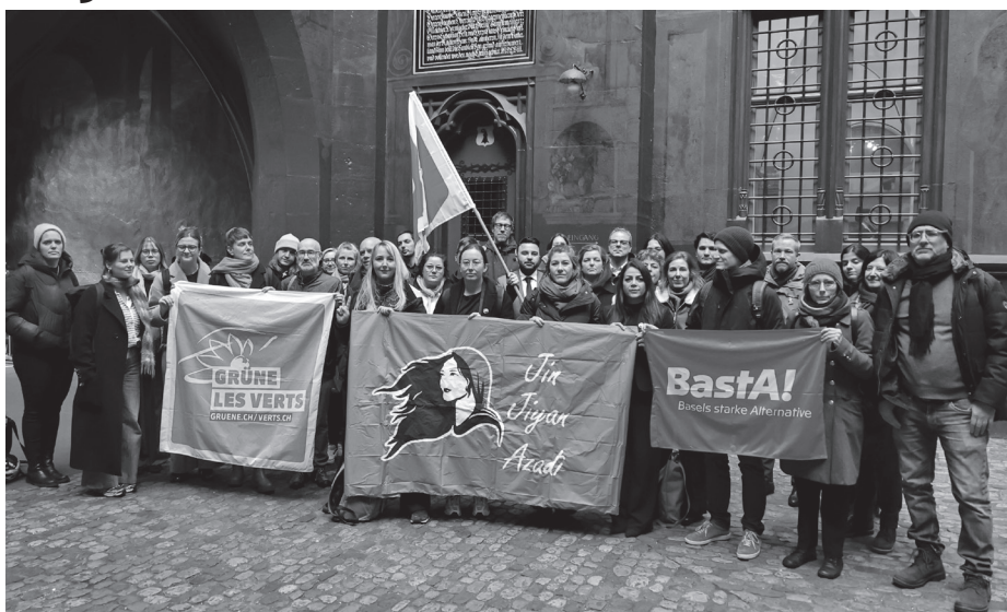
Am 21. Januar drückten die Grossratsfraktionen SP Basel-Stadt, GRÜNE/jgb und BastA! ihre Solidarität mit den Menschen in Iran, Rojhilat und Rojava aus. Mehr Infos auf basta-bs.ch